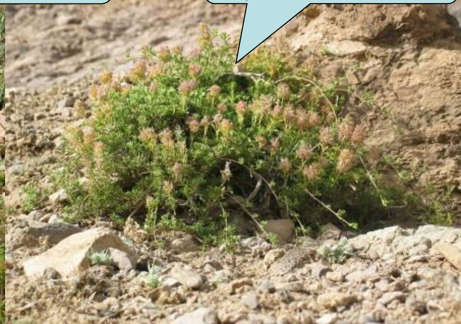
Thym الزعيترة Thymus satureioides